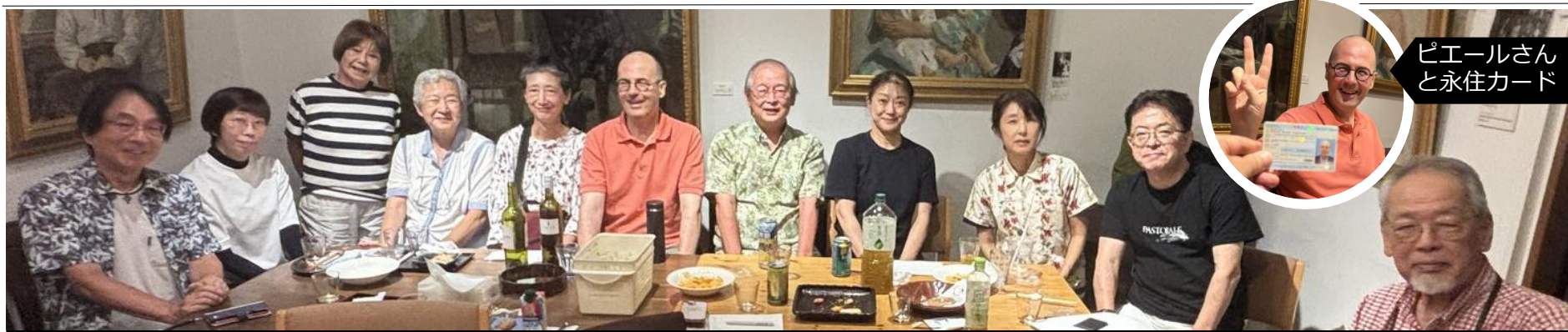
記念すべき第1回に集まって下さった皆さん